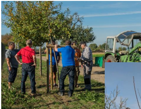
Apfelbaumweg am Gewerbegebiet FWG-Pflegeaktion 2018